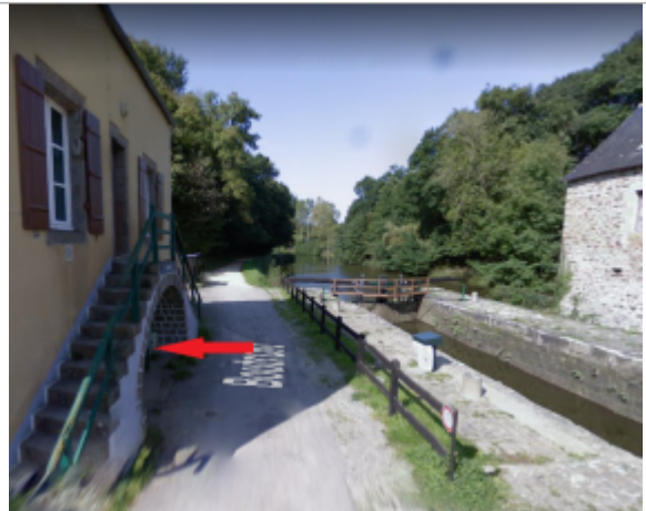
Vue d'ensemble du site

Coordonnées WGS84 : X: -2.01450870 / Y: 48.41802800