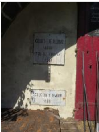
repères sur la maison éclusière photo de 2019

Altitude calculée de l'eau (en m) : 10.82 m