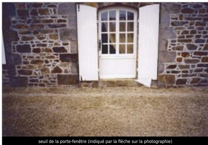
seuil de la porte-fenêtre (indiqué par la flèche sur la photographie)

SOURCE DE REPÉRAGE : CAMPAGNE ATLAS ZONE INONDABLE 2001 - 06/07/2019