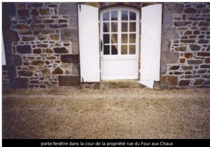
porte-fenêtre dans la cour de la propriété rue du Four aux Chaux