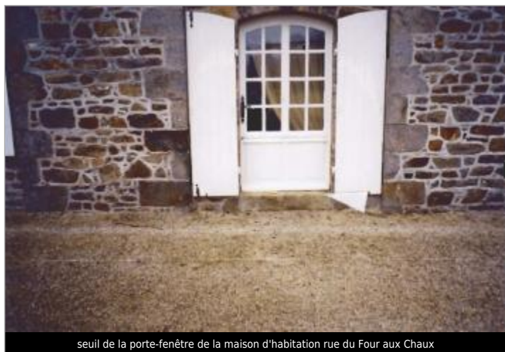
seuil de la porte-fenêtre de la maison d'habitation rue du Four aux Chaux

Organisme(s) : SPC Vilaine - Côtiers bretons