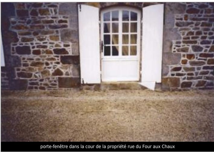
porte-fenêtre dans la cour de la propriété rue du Four aux Chaux

GÉOLOCALISATION Coordonnées WGS84 : X: -2.03552560 / Y: 48.45164010 Coordonnées RGF93 (Lambert 93) X: 327905.88 / Y: 6828687.04 Coordonnées RGF93 (ETRS89) : X: -2.0355256 / Y: 48.4516401 Code Hydro: J0--0160 Rive de référence: Droite