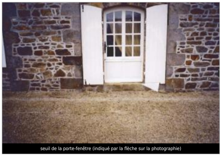
seuil de la porte-fenêtre (indiqué par la flèche sur la photographie)

MARQUE Maximum de l'inondation : Oui Visibilité : Non État du repère : Bon Pérennité : Longue Repère calculé : Non PHEC : Non