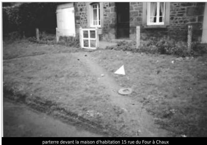
parterre devant la maison d'habitation 15 rue du Four à Chaux