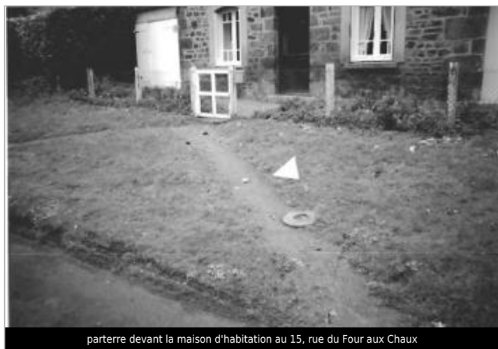
parterre devant la maison d'habitation au 15, rue du Four aux Chaux