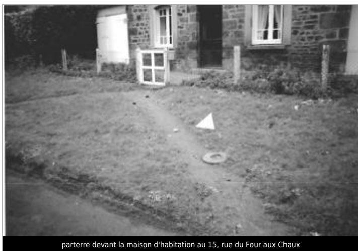
parterre devant la maison d'habitation au 15, rue du Four aux Chaux