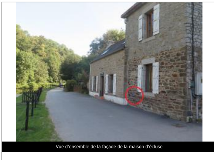
Vue d'ensemble de la façade de la maison d'écluse