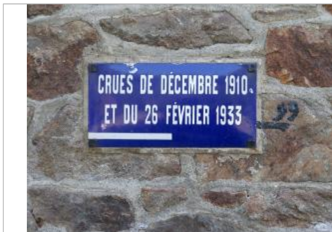
plaque des crues de 1910 et 1933

Altitude calculée de l'eau (en m) : 8.93 m