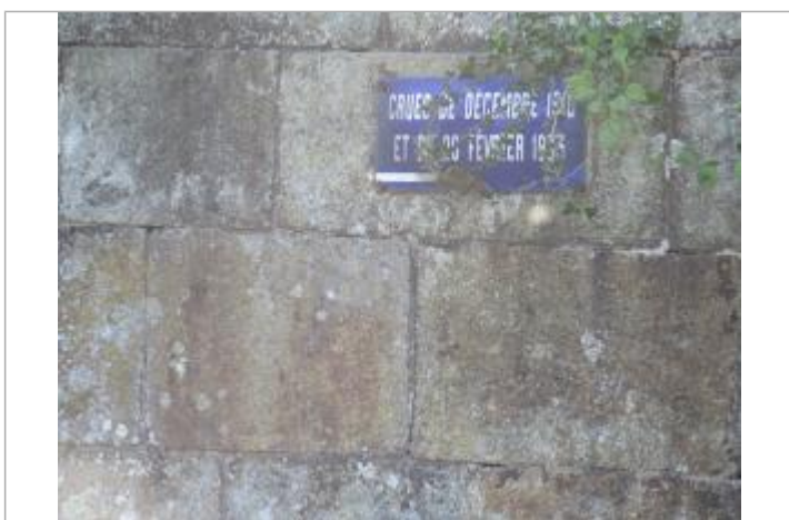
Plaque sur le mur amont de l'écluse de Pont-Perrin

Code : SPC VCB 22100-006 Date de mise à jour : 18/03/2020 Auteur : SPC VCB