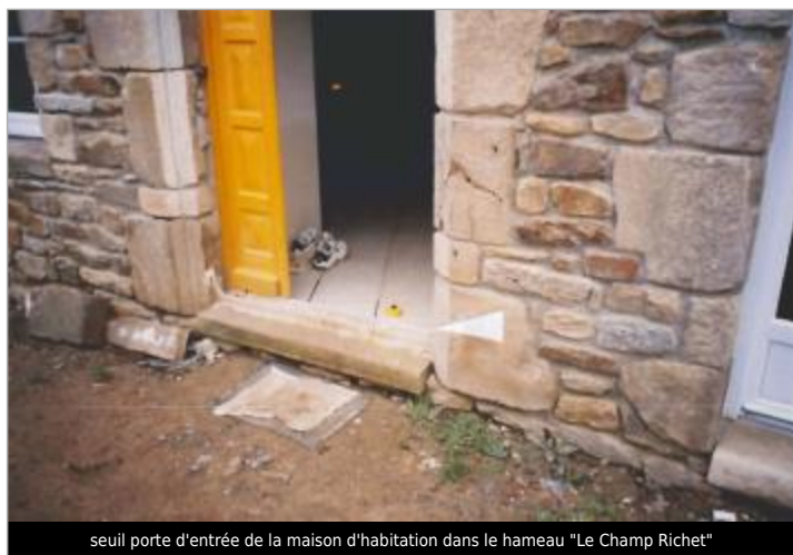
seuil porte d'entrée de la maison d'habitation dans le hameau "Le Champ Richet"

SOURCE DE REPÉRAGE : CAMPAGNE ATLAS ZONE INONDABLE 2001 - 06/07/2019