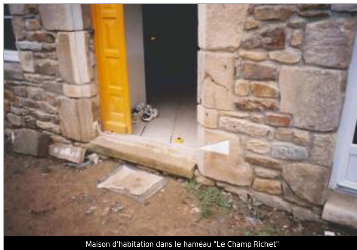
Maison d'habitation dans le hameau "Le Champ Richet"