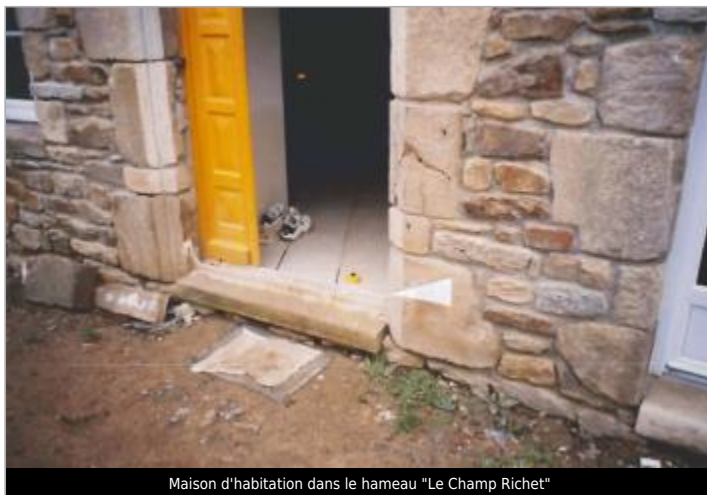
Maison d'habitation dans le hameau "Le Champ Richet"