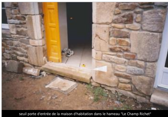
seuil porte d'entrée de la maison d'habitation dans le hameau "Le Champ Richet"

SOURCE DE REPÉRAGE : CAMPAGNE ATLAS ZONE INONDABLE 2001 - 06/07/2019