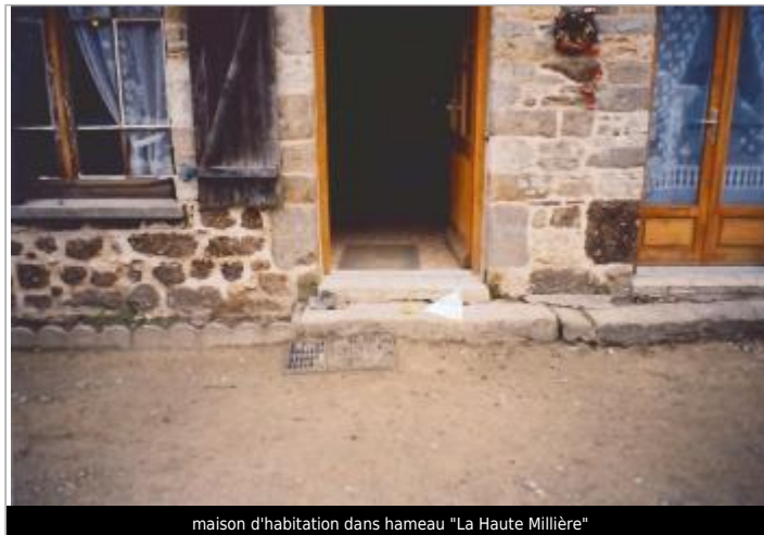
maison d'habitation dans hameau "La Haute Millière"

Coordonnées WGS84 : X: -2.01925790 / Y: 48.36654500