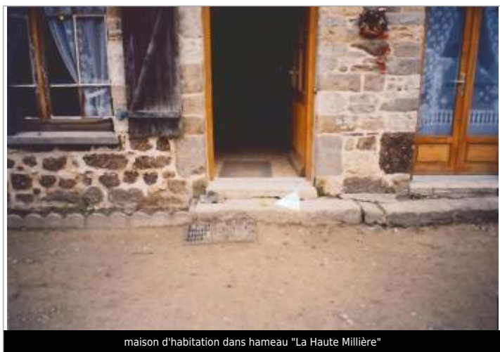
maison d'habitation dans hameau "La Haute Millière"

Altitude calculée de l'eau (en m) : 15.15 m