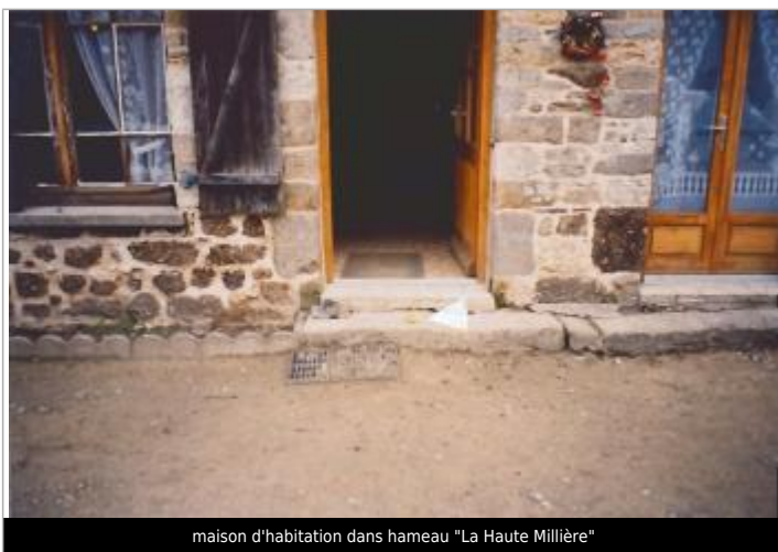
maison d'habitation dans hameau "La Haute Millière"

Altitude calculée de l'eau (en m) : 15.15 m