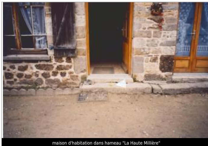
maison d'habitation dans hameau "La Haute Millière"