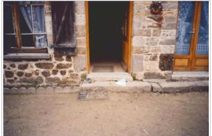
maison d'habitation dans hameau "La Haute Millière"