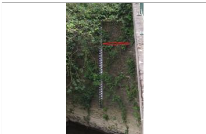
Echelle limnimétrique à l'amont du pont de la RD837 entre Pont-Péan et Chartes de Bretagne