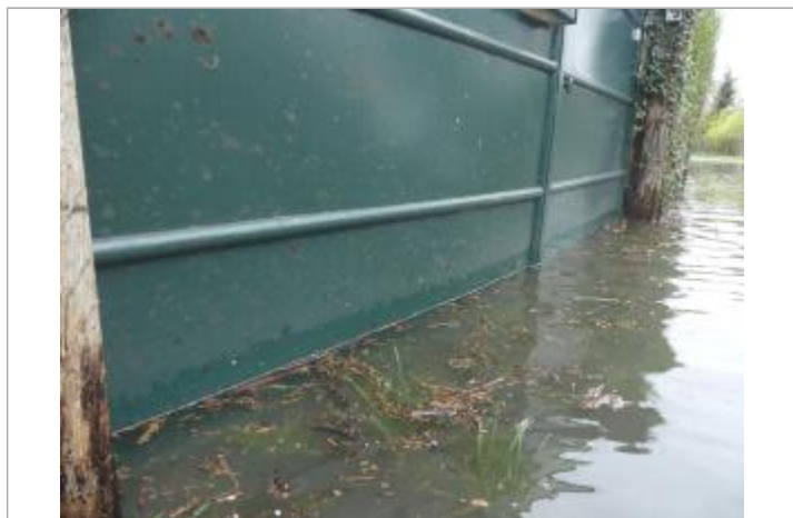
Vue sur le niveau d'eau

Organisme(s) : SPC Seine aval - Côtiers normands