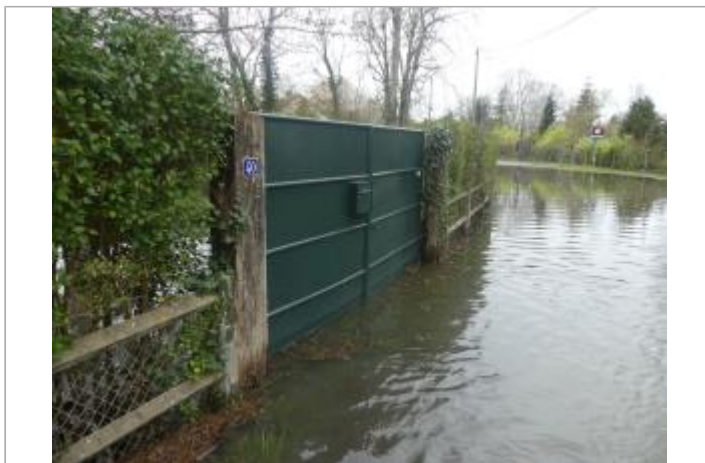
Vue sur le portail