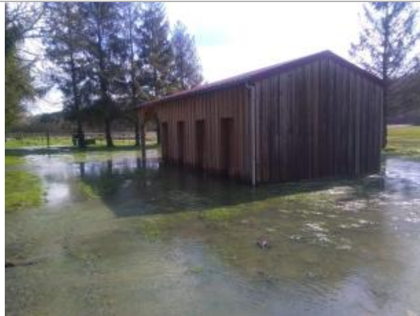
Vue sur la cabane en bois