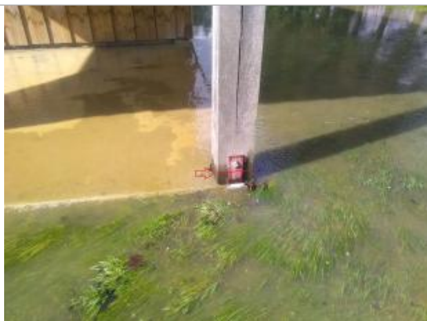
Vue sur la base du poteau. Le trait rouge est sans doute le vrai niveau du cours d'eau

SOURCE DE REPÉRAGE : VISITE DE TERRAIN SPC SACN - 11/03/2020