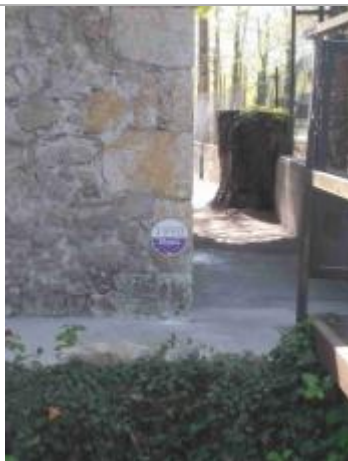
repère de crue