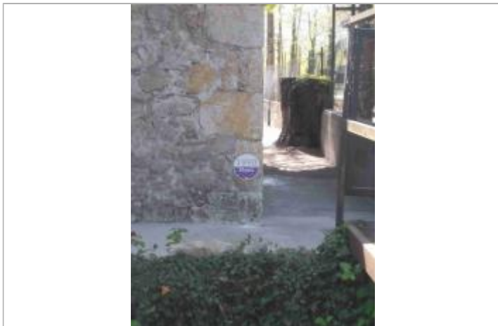
repère de crue