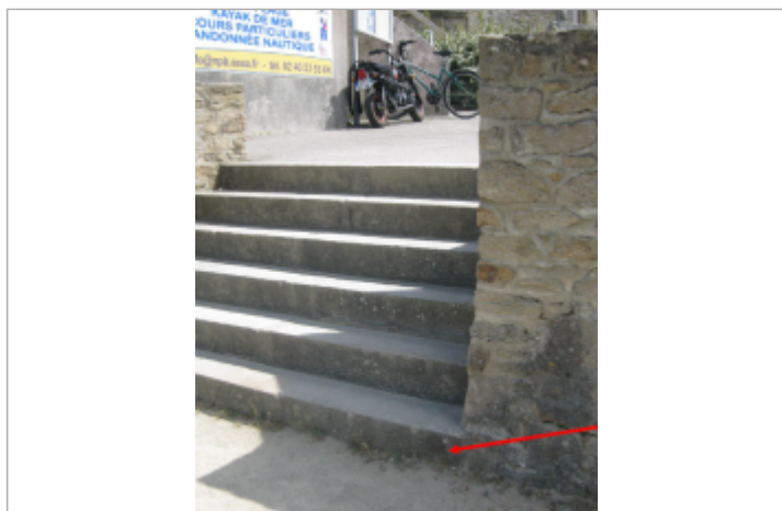
Photo repère Xynthia 2010