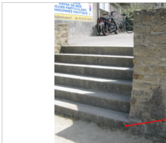
Photo repère Xynthia 2010