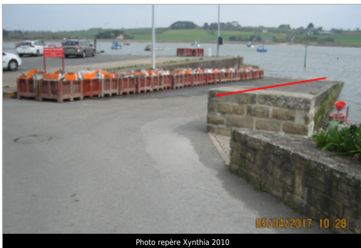
Photo repère Xynthia 2010

Altitude calculée de l'eau (en m) : 4.8 m