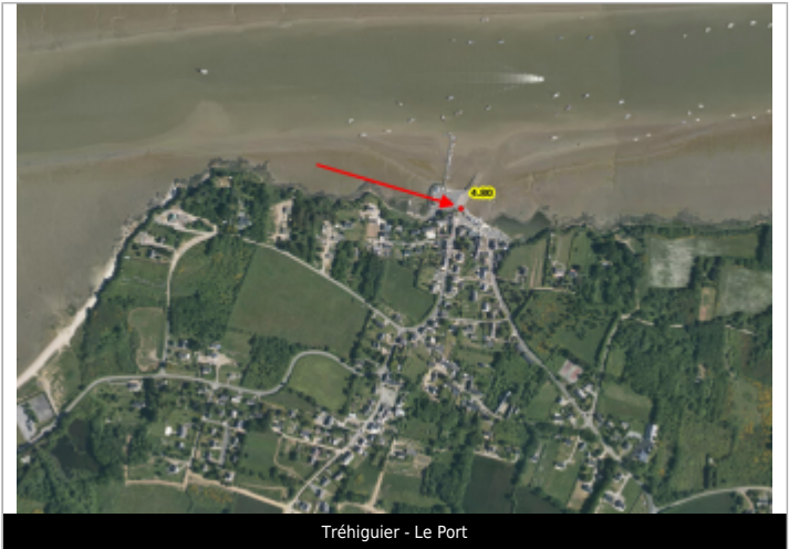
Tréguier - Le Port