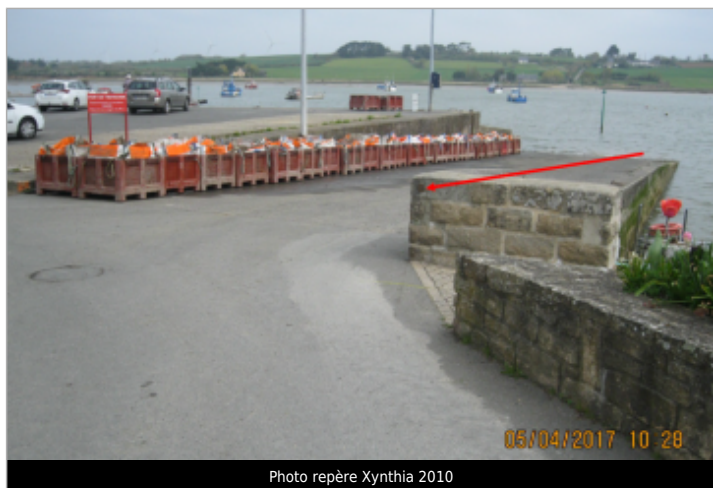
Photo repère Xynthia 2010