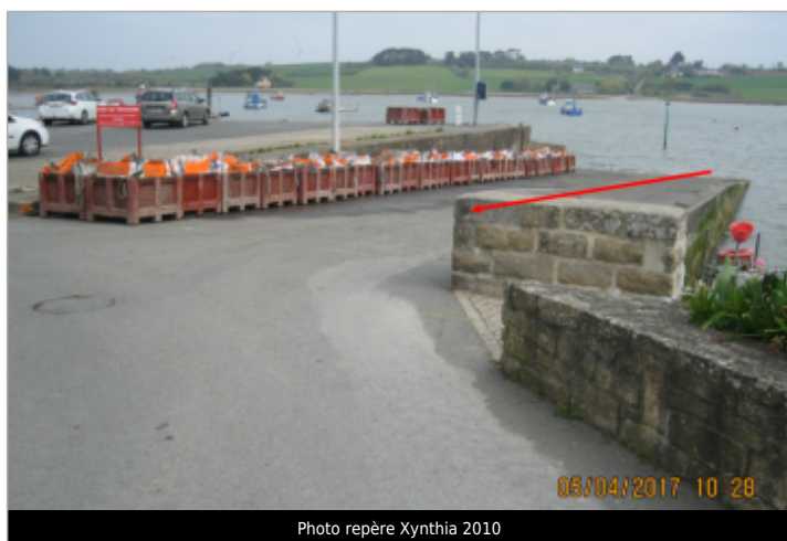
Photo repère Xynthia 2010