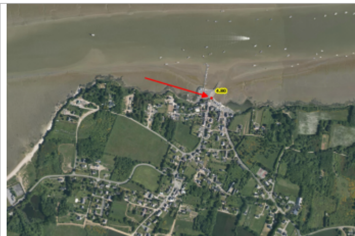
Tréguier - Le Port