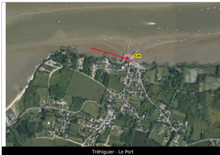
Tréhiguier - Le Port