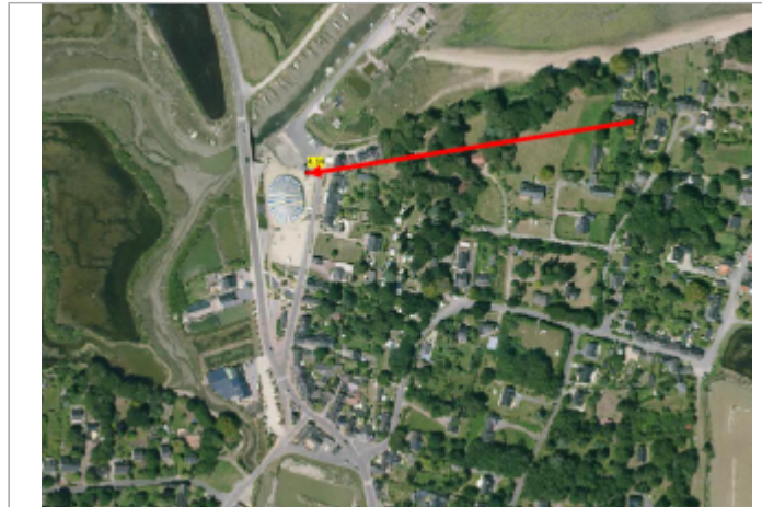
Rue du Port