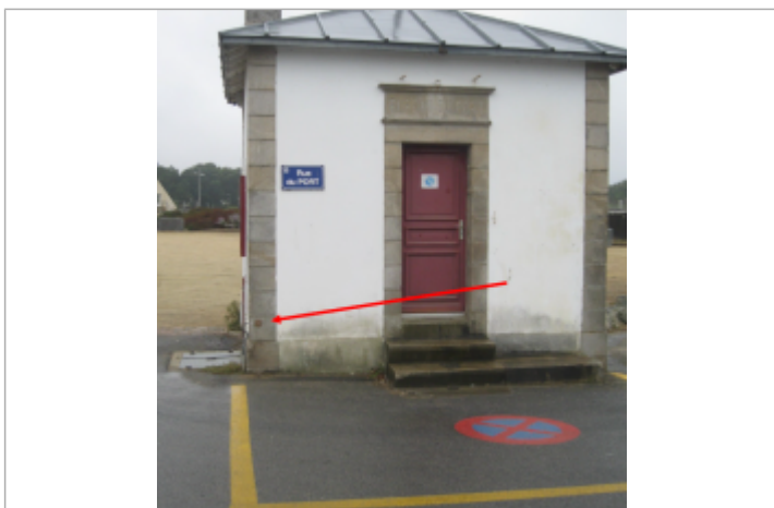
Photo repère Xynthia 2010