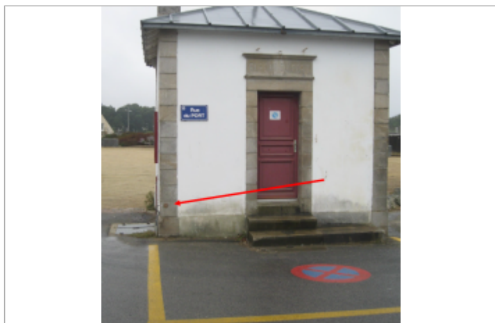
Photo repère Xynthia 2010