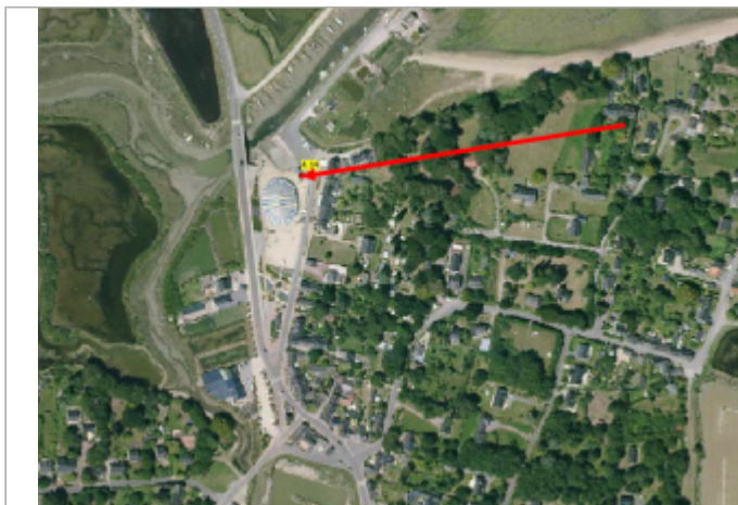
Rue du Port