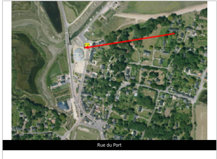
Rue du Port