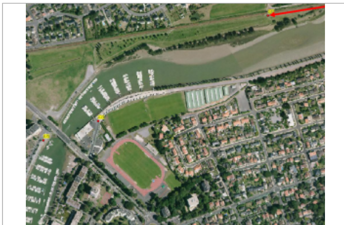
Le Temps Perdu