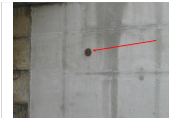
Photo repère Xynthia 2010