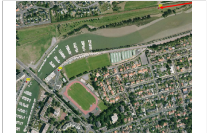
Le Temps Perdu