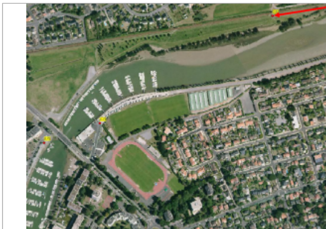
Le Temps Perdu