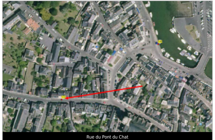
Rue du Pont de Chat