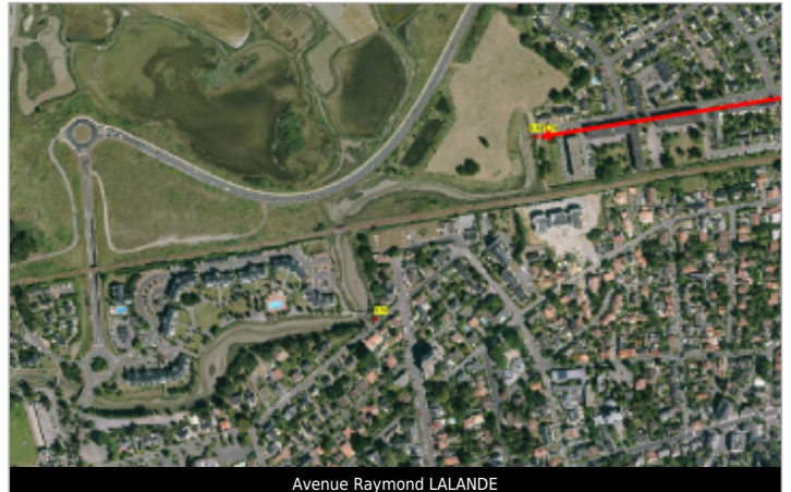
Avenue Raymond LALANDE