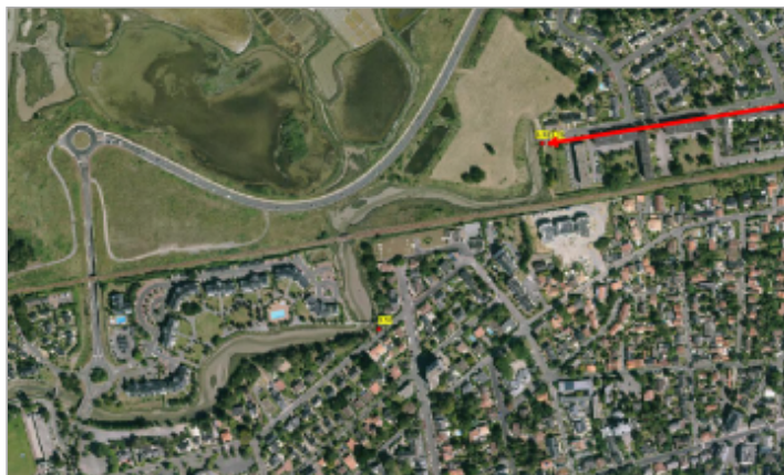
Avenue Raymond LALANDE