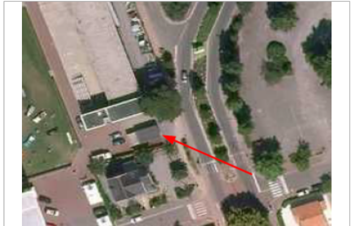
Avenue Marguerite Jean