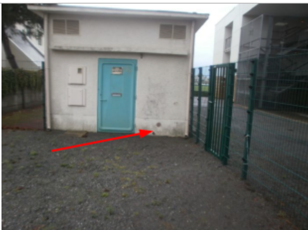
Photo repère Xynthia 2010

Altitude calculée de l'eau (en m) : 3.57 m