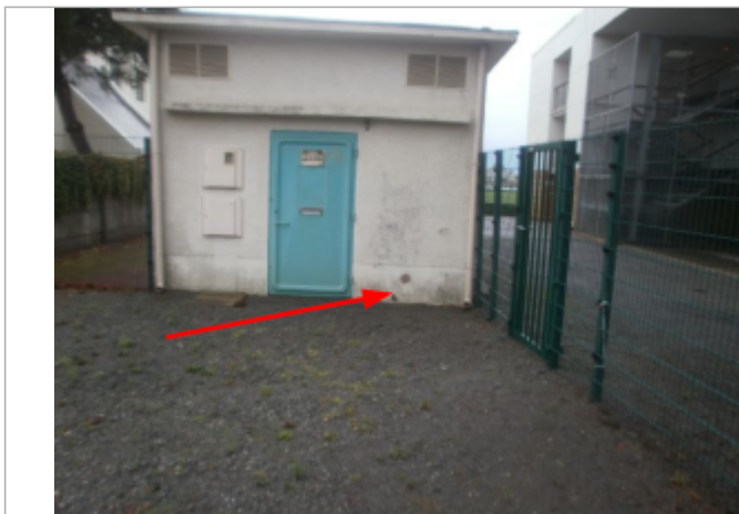
Photo repère Xynthia 2010