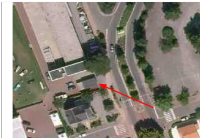
Avenue Marguerite Jean