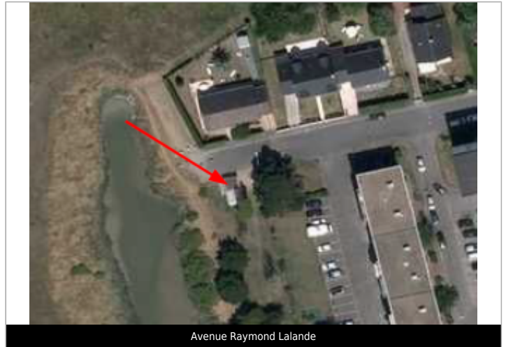
Avenue Raymond Lalande