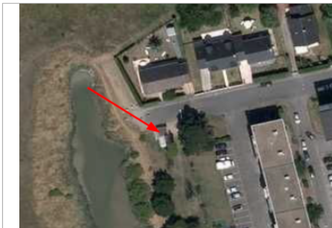
Avenue Raymond Lalande