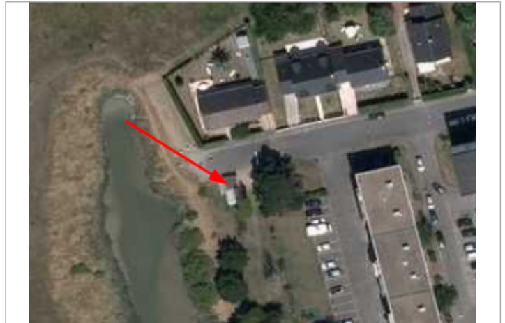
Avenue Raymond Lalande