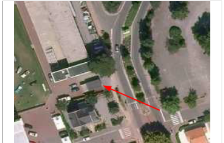
Avenue Joyeuse - Poste EDF