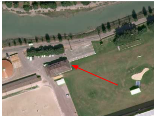
Centre équestre - Paddock