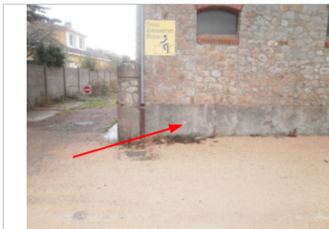
Photo repère Xynthia 2010