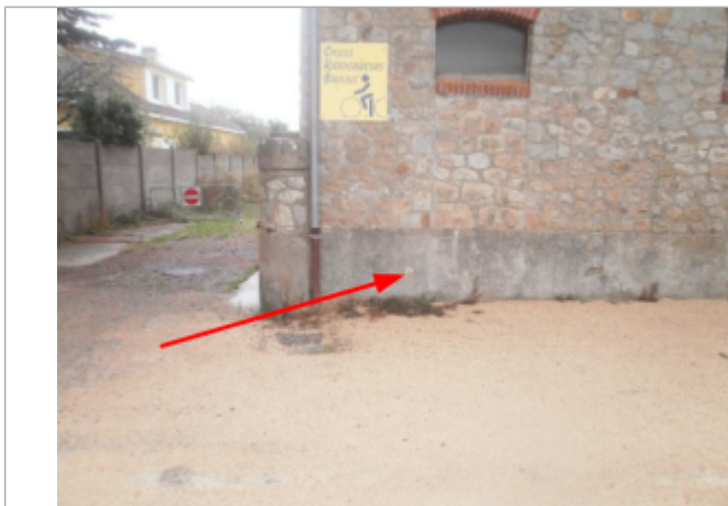
Photo repère Xynthia 2010