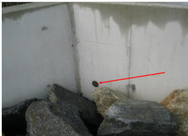
Photo repère Xynthia 2010

Altitude calculée de l'eau (en m) : 3.58 m