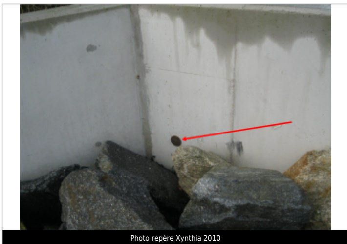
Photo repère Xynthia 2010