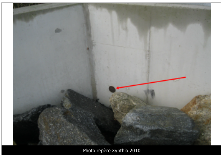
Photo repère Xynthia 2010