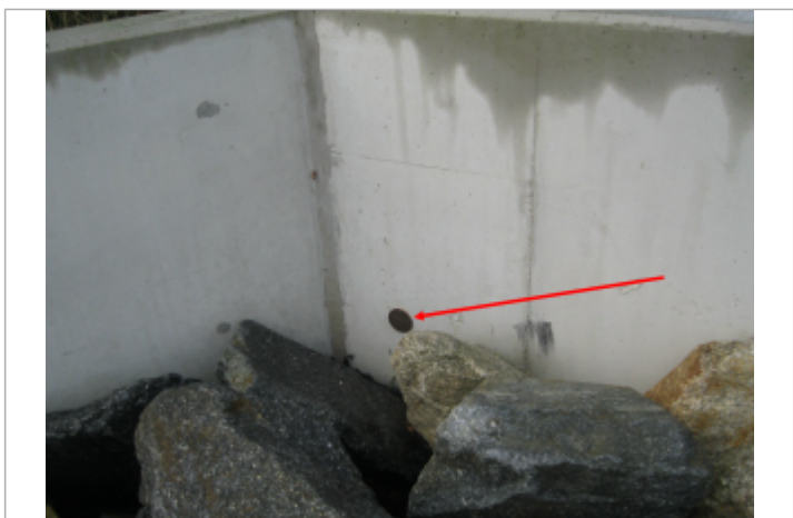
Photo repère Xynthia 2010

MARQUE Texte : 2010 Xynthia Visibilité : Oui