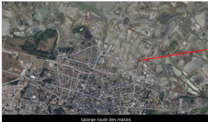
salorge route des marais