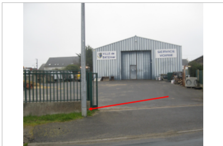
Photo repère Xynthia 2010

Système altimétrique : NGF IGN 1969 (système normal)