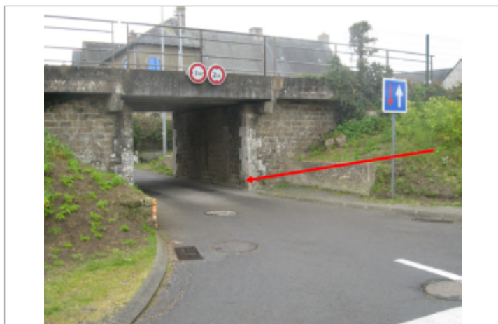
Photo repère Xynthia 2010

Système altimétrique : NGF IGN 1969 (système normal)