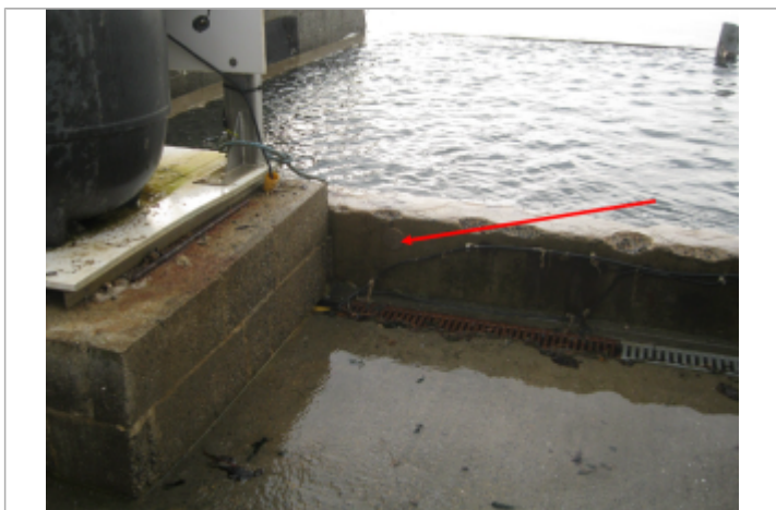
Photo repère Xynthia 2010