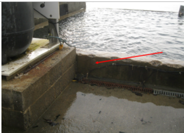
Photo repère Xynthia 2010

Altitude calculée de l'eau (en m) : 4.01