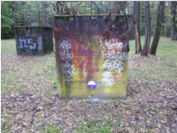
crue de la Menoge et de l'Arve du 1 au 4 mai 2015