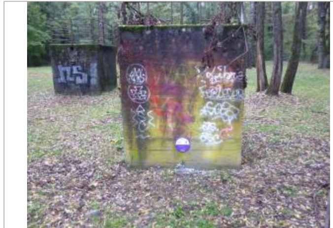
mur du puits de captage