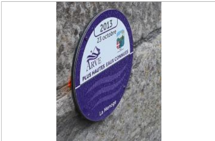
crue de la Menoge du 23 octobre 2013