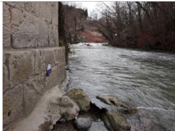
pont de la RD1205 sur la Menoge