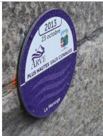
crue de la Menoge du 23 octobre 2013