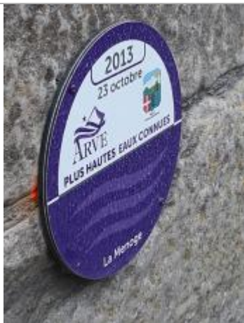
crue de la Menoge du 23 octobre 2013