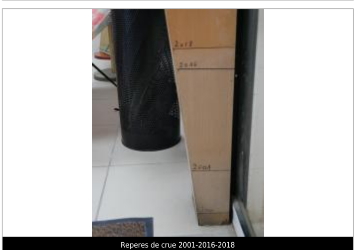
Reperes de crue 2001-2016-2018