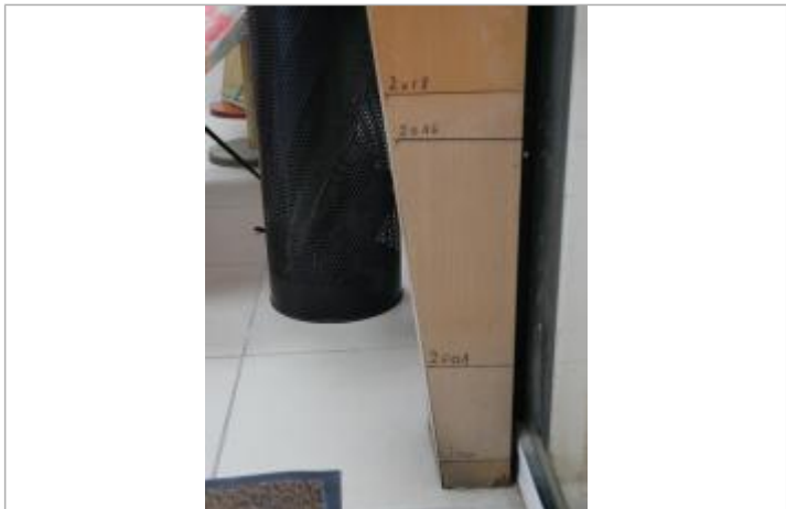
Reperes de crue 2001-2016-2018