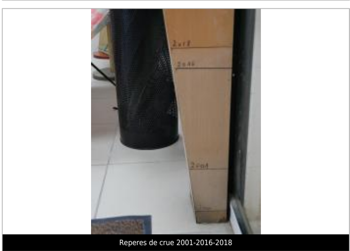
Reperes de crue 2001-2016-2018