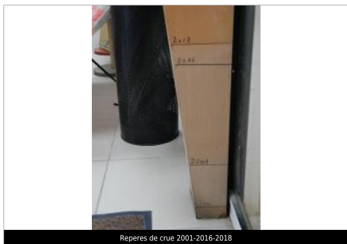
Reperes de crue 2001-2016-2018