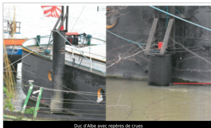
Duc d'Albe avec repères de crues