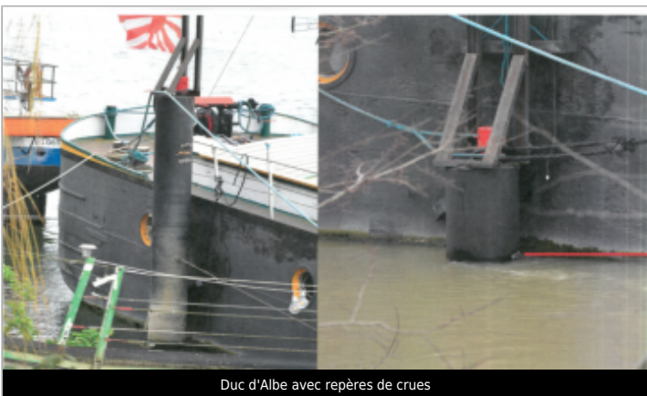
Duc d'Albe avec repères de crues

GÉOLOCALISATION Coordonnées WGS84 : X: 2.17276950 / Y: 48.98032100 Coordonnées RGF93 (Lambert 93) : X: 639448.24 / Y: 6875915.41 Coordonnées RGF93 (ETRS89) : X: 2.1727695 / Y: 48.980321 Code Hydro : ----0010 Rive de référence :