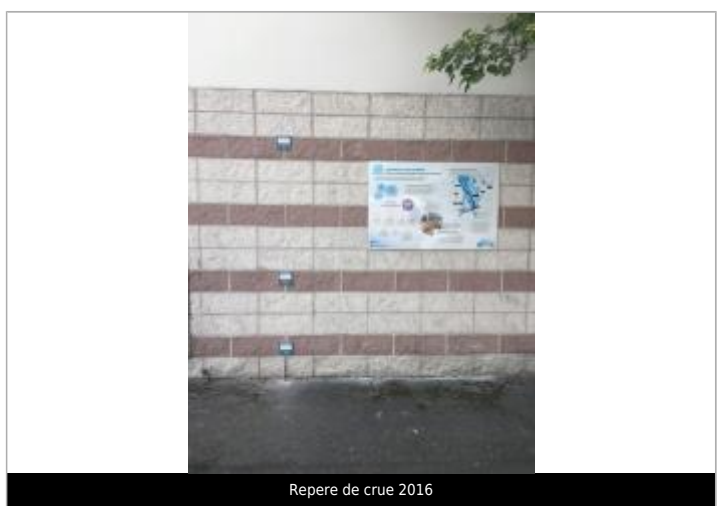
Repere de crue 2016

MARQUE Texte : Crue vicennale Type 2016 Visibilité : Oui État du repère : Bon