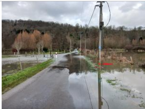
Vue depuis la RD 714

Coordonnées WGS84 : X: 1.30843609 / Y: 49.34788680