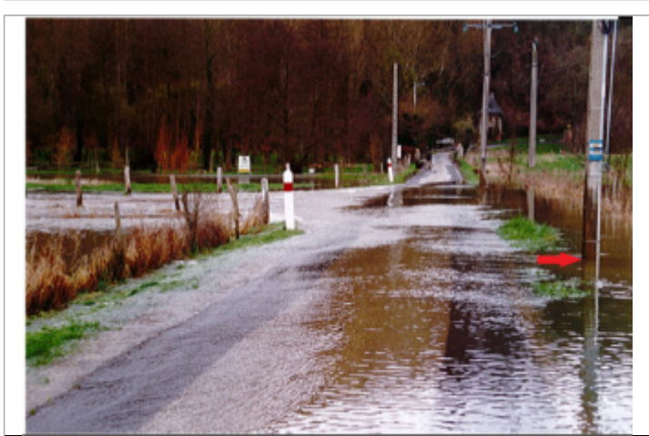
Poteau électrique situé au niveau du carrefour entre la RD714 et la rue de Fontaine Guérard

MARQUE Maximum de l'inondation : Non renseigné Visibilité : Oui État du repère : Disparu Pérennité : Aucune Repère calculé : Non PHEC : Non renseigné