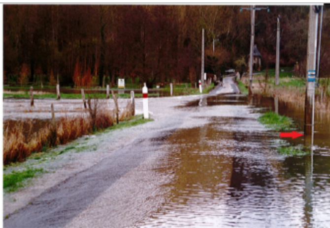
Poteau électrique situé au niveau du carrefour entre la RD714 et la rue de Fontaine Guérard