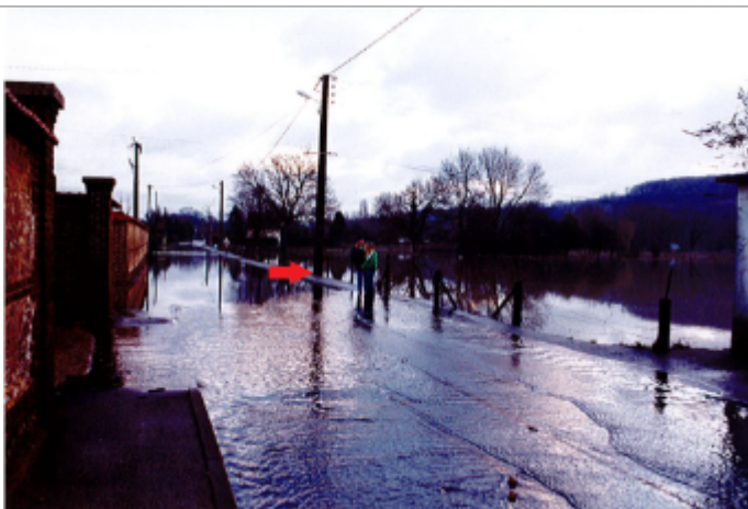
Poteau électrique face au 626 rue Blingue à Romilly-sur-Andelle