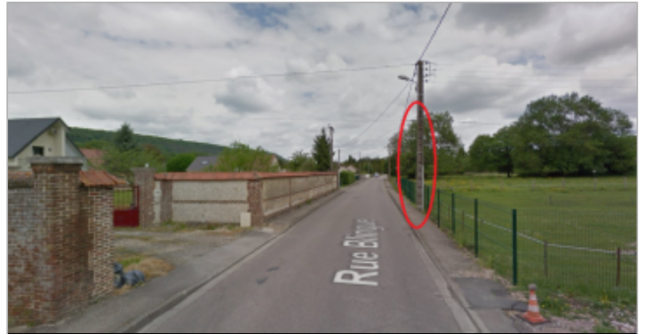
Poteau électrique face au 626 rue Blingue à Romilly-sur-Andelle