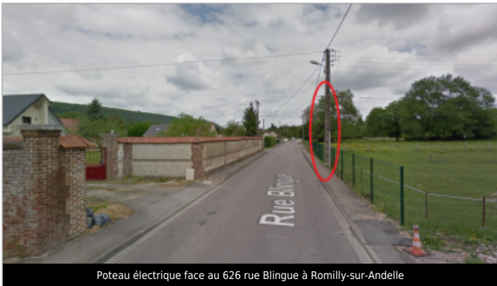
Poteau électrique face au 626 rue Blingue à Romilly-sur-Andelle

GÉOLOCALISATION Coordonnées WGS84 : X: 1.26611160 / Y: 49.33009700 Coordonnées RGF93 (Lambert 93) X: 573944.63 / Y: 6915886.69 Coordonnées RGF93 (ETRS89) : X: 1.2661116 / Y: 49.330097 Code Hydro: H32-0400 Rive de référence: Droite