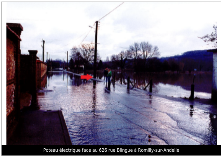
Poteau électrique face au 626 rue Blingue à Romilly-sur-Andelle

MARQUE Maximum de l'inondation : Non renseigné Visibilité : Non renseigné État du repère : Disparu Pérennité : Aucune Repère calculé : Non renseigné PHEC : Non renseigné