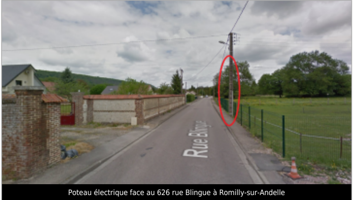
Poteau électrique face au 626 rue Blingue à Romilly-sur-Andelle

GÉOLOCALISATION Coordonnées WGS84 : X: 1.26611160 / Y: 49.33009700 Coordonnées RGF93 (Lambert 93) X: 573944.63 / Y: 6915886.69 Coordonnées RGF93 (ETRS89) : X: 1.2661116 / Y: 49.330097 Code Hydro: H32-0400 Rive de référence: Droite