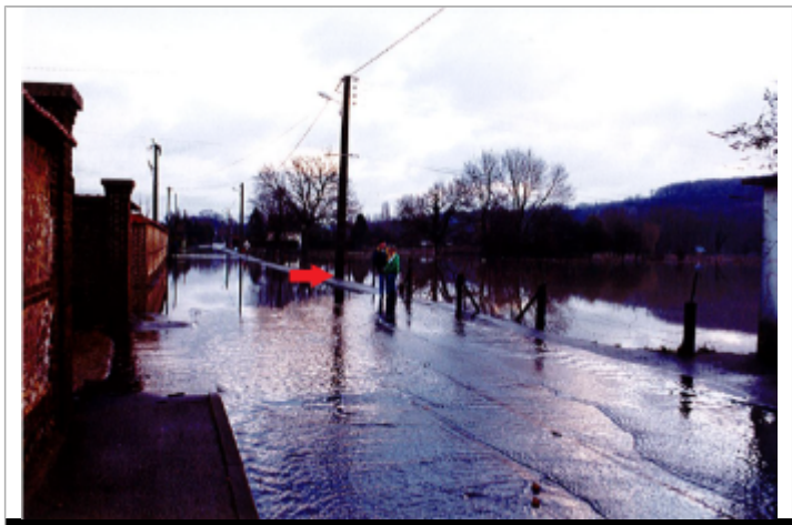
Poteau électrique face au 626 rue Blingue à Romilly-sur-Andelle

MARQUE Maximum de l'inondation : Non renseigné Visibilité : Non renseigné État du repère : Disparu Pérennité : Aucune Repère calculé : Non renseigné PHEC : Non renseigné