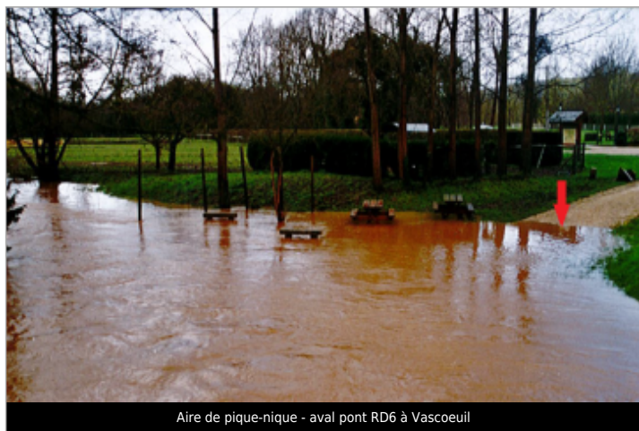
Aire de pique-nique - aval pont RD6 à Vascoeuil