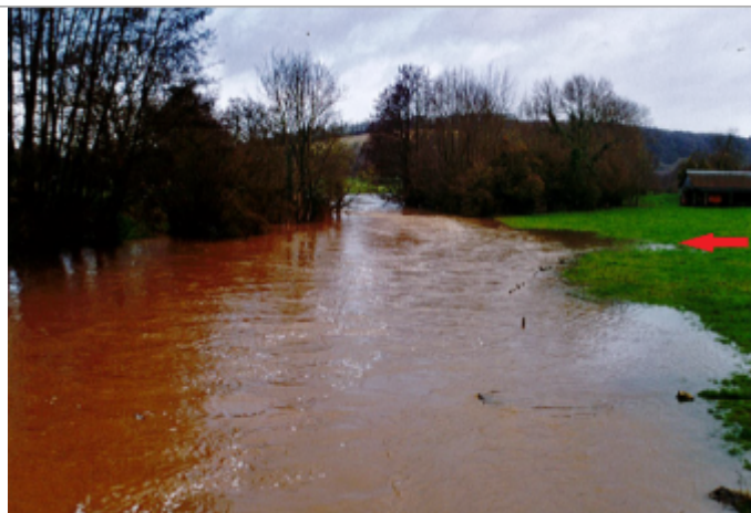
Prairie amont du pont de la RD6 à Vascoeuil

Organisme : SPC Seine aval - Côtiers normands