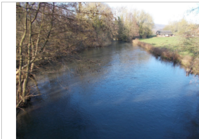
Prairie amont du pont de la D6 à Vascoeuil