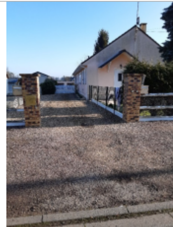
6 rue Claude Monet à Romilly-sur-Andelle