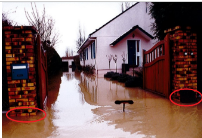
6 rue Claude Monet à Romilly-sur-Andelle